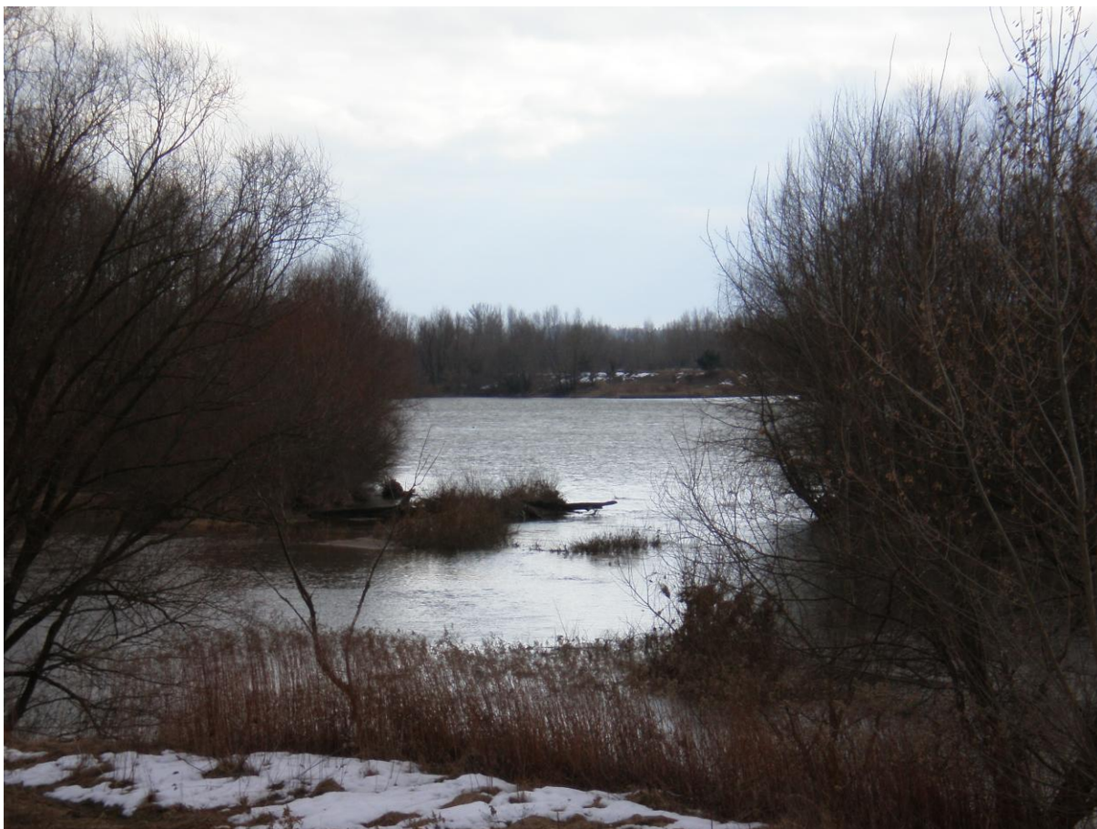
„Ostrówek – widok na Wisłę”