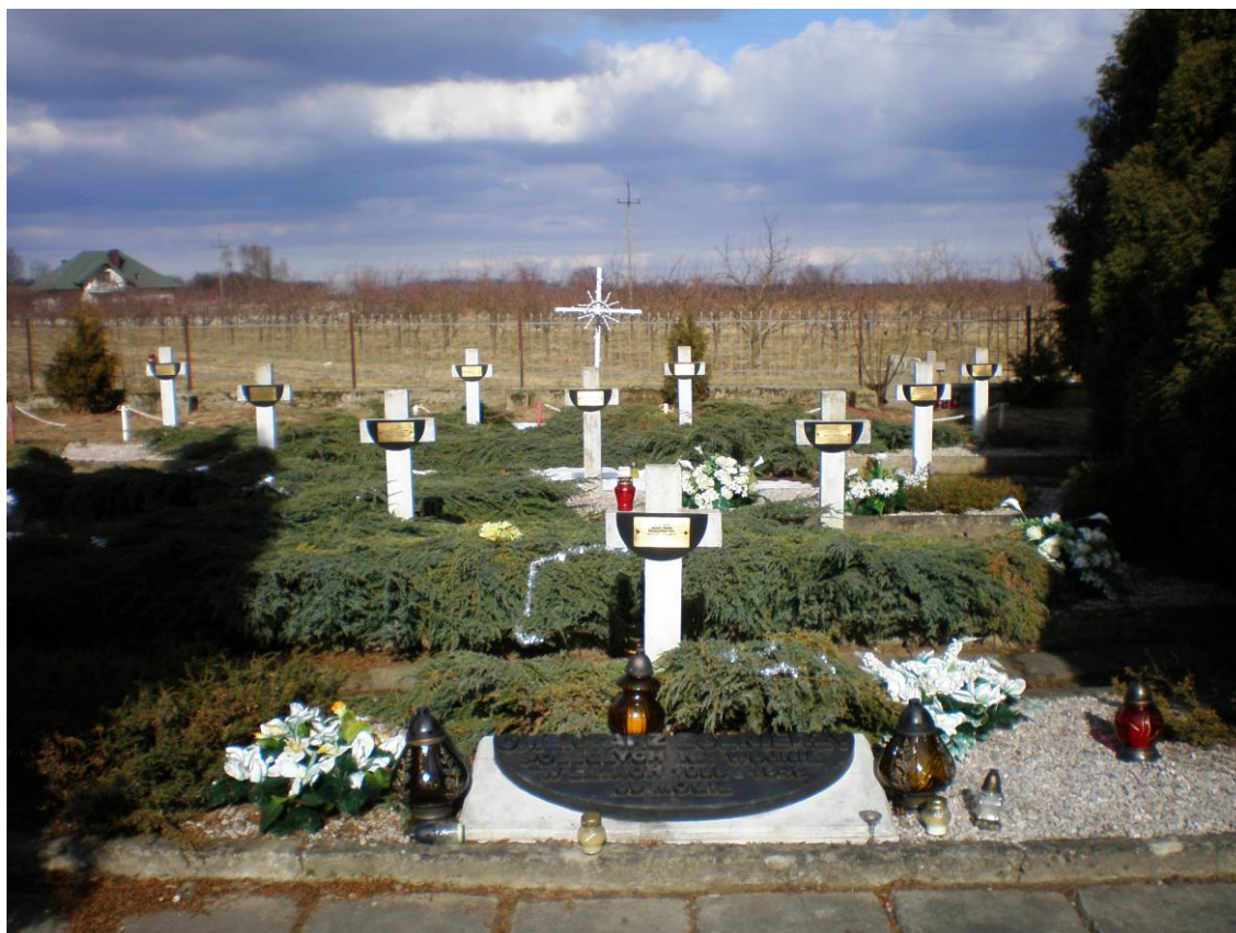
„Aleja poległych żołnierzy znanych i nieznanych z okresu II wojny światowej, znajdująca się na miejscowym cmentarzu parafialnym (1939-1945)s

W rezultacie wdrożenie planu przyczyni się z całą pewnością do rozwoju naszej miejscowości, rozwoju małej przedsiębiorczości, tworzenia nowych miejsc pracy, aktywizacji społeczeństwa.