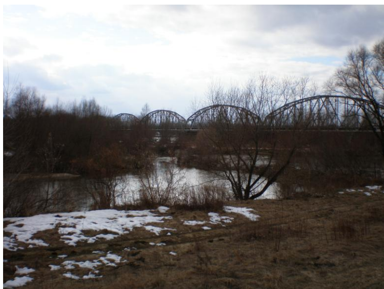
„Most kolejowy spinający oba brzegi Wisły, wybudowany w 1952 – widok od strony Ostrówka”

„Most kołowy, wybudowany w 1953r. – jest częścią trasy krajowej nr 50, łączącej Berlin i Moskwę . Czynione są starania aby most ten otrzymał nazwę Gen. Michała Sokolnickiego – głównodowodzącego wojsk polskich w bitwie pod Ostrówkiem 203 maja 1809 r. - widok od strony Ostrówka”