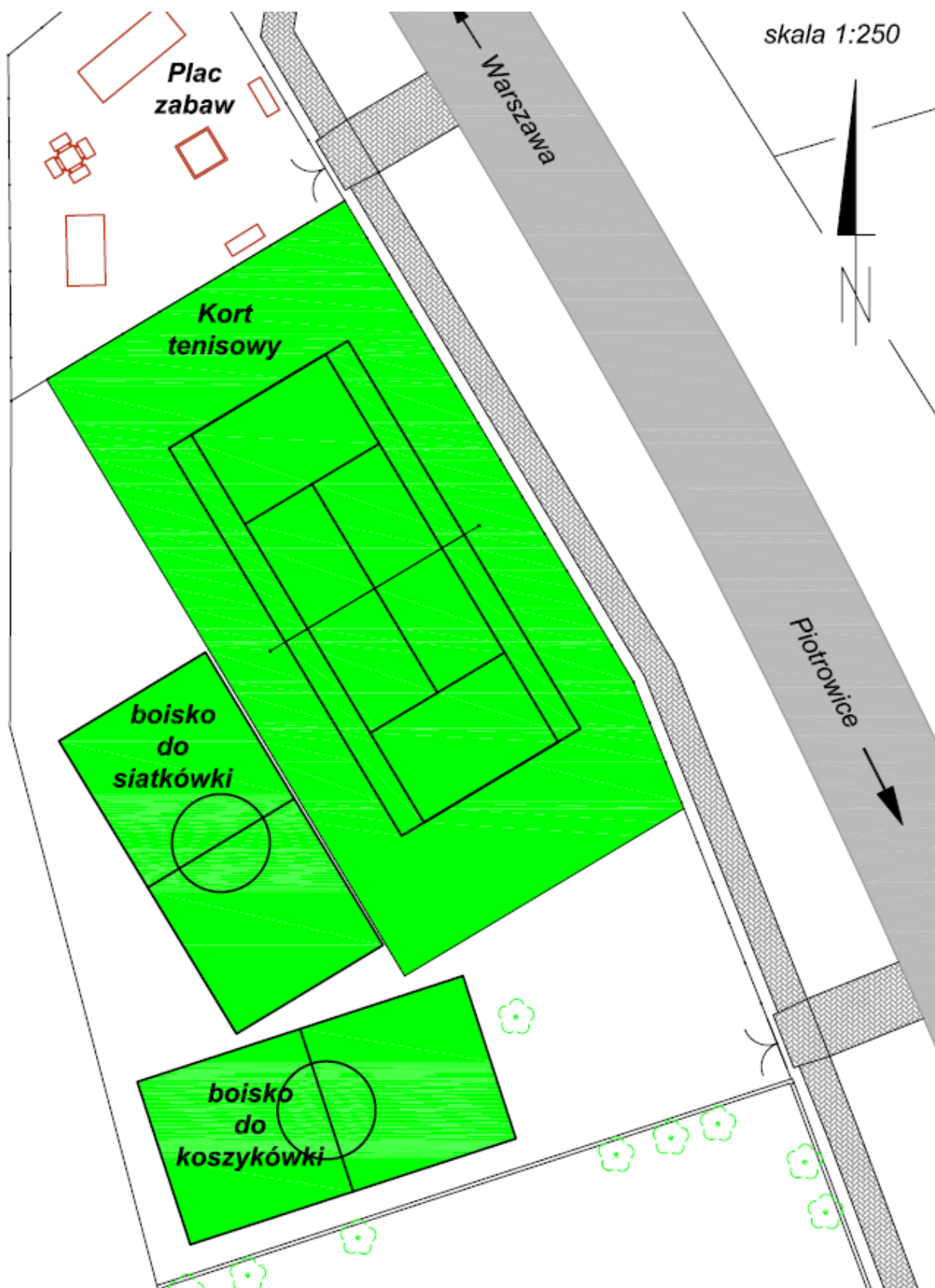
Usytuowanie planowanych do budowy boisk do siatkówki, koszykówki oraz kortu tenisowego.